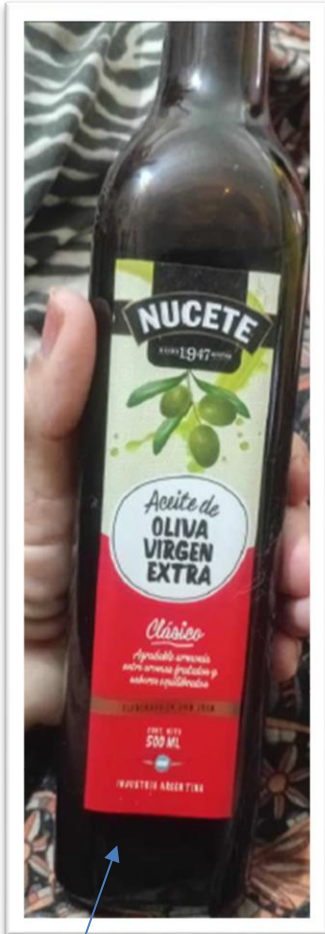
Color del envase "Caramelo"