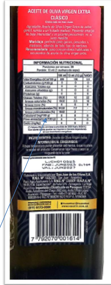
Valores de tabla nutricional diferentes.