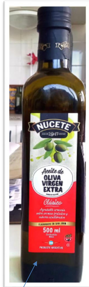
Color del envase "Verde oscuro"